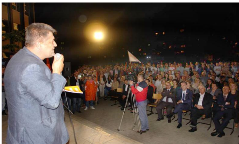
Zafiri duke kërkuar besimin e qytetarëve për të vazhduar angazhimin e tij në të mirë të vendit