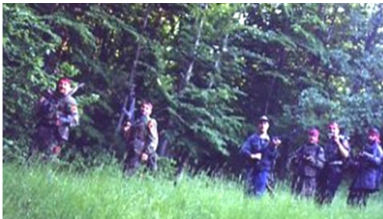
Duke u kthyer nga një aksion, në malet e Opojës, maj 1999