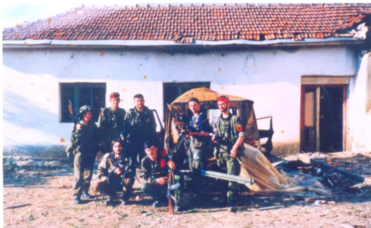
Zafiri me bashkëlufftëtarë para makineris së shkatërruar serbe në Kushtrim, qershor 1999