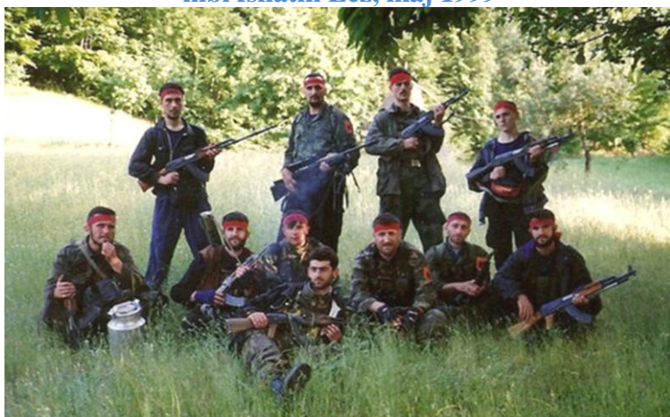
Njësitë gueril në malet e Vërrinit, maj 1999