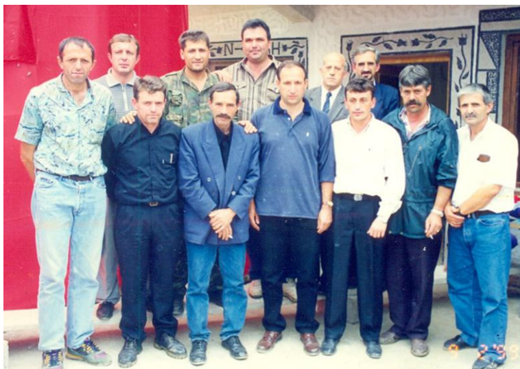
Grup luftëtarësh të Brigadës 125 në Jeshkovë, shtator 1999