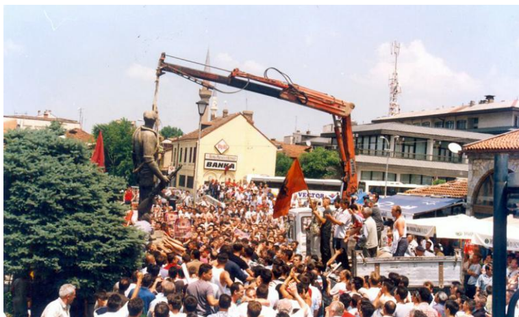
Masa popullore e tubuar për vendosjen e shtatores së heroit të Kosovës, Xhevat Berisha - 10 qershor 2003