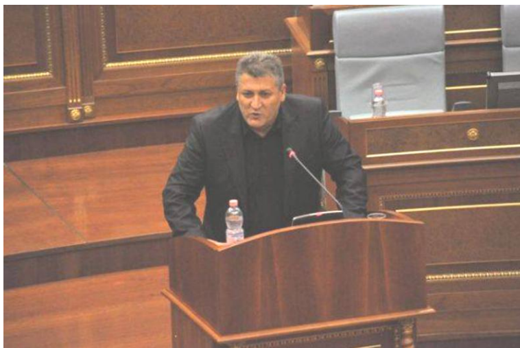
Zafiri gjatë një fjalimi në Kuvendin e Republikës së Kosovës