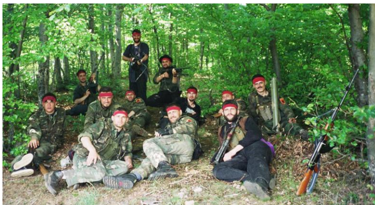
Në malet e fshatit Brrut të Opojës, qershor 1999