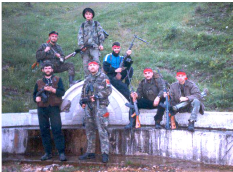
Të gatshëm për aksion në malet mbi fshatin Lez, maj 1999