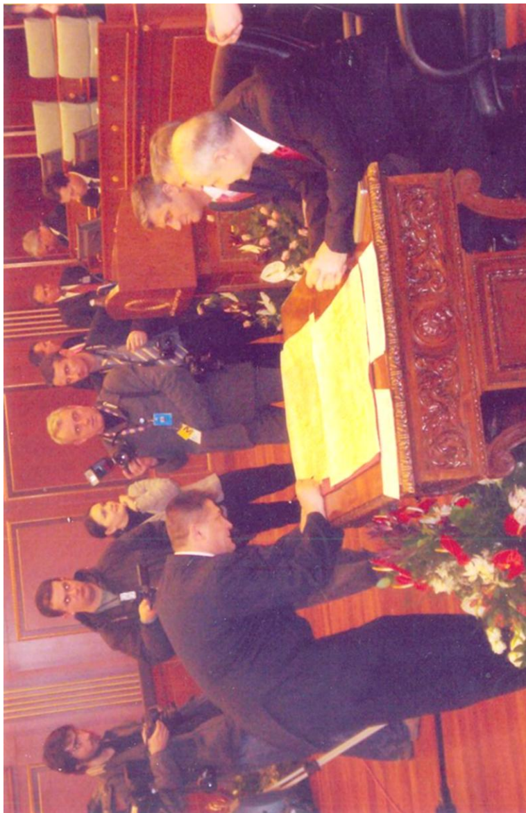
Nënshkrimi i dokumentit të Pavarësisë së Republikës së Kosovës , 17 shkurt 2008