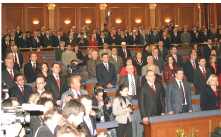
Zafiri në sallën e Kuvendit të Kosovës gjatë leximit të Deklaratës së Pavarësisë, 17 Shkur 2008