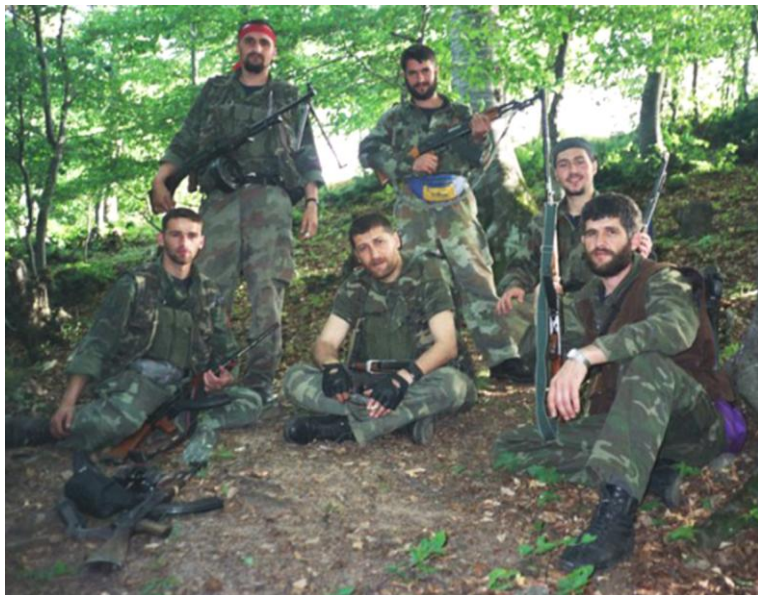
Njësitë gueril në malet e Jeshkovës, maj 1999