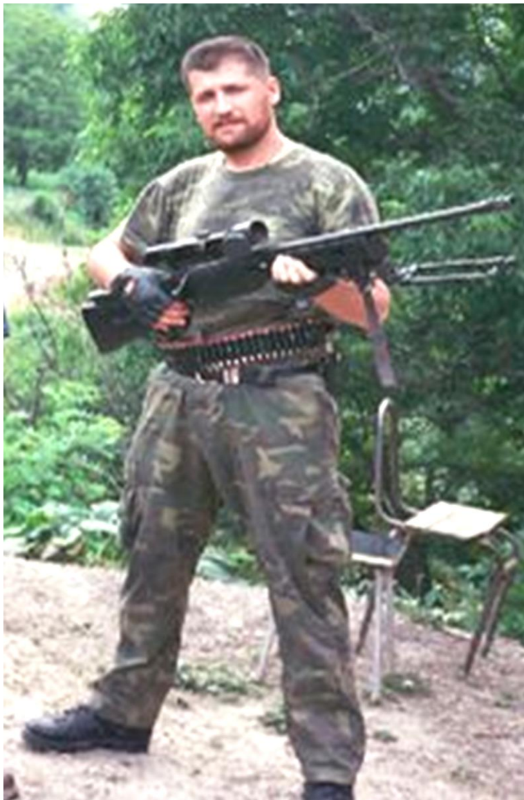
Zafiri në Malësi të Vërrinit, maj 1999