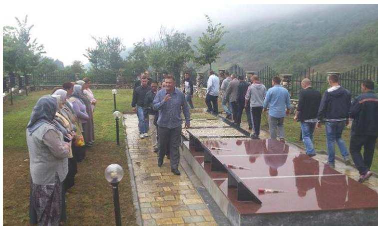
Zafiri në nderim të dëshmorëve në Jeshkovë