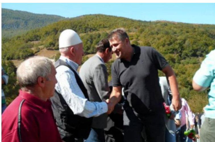
Zafiri i pritur nga familjet e dëshmorëve në Jeshkovë