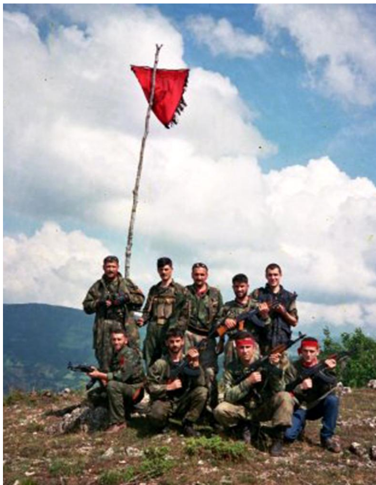
Ngritja e flamurit në malet e Vërrinit, 10 qersho 1999