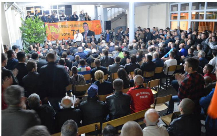
Zafiri duke kërkuar besimin e qytetarëve për të vazhduar angazhimin e tij në të mirë të vendit