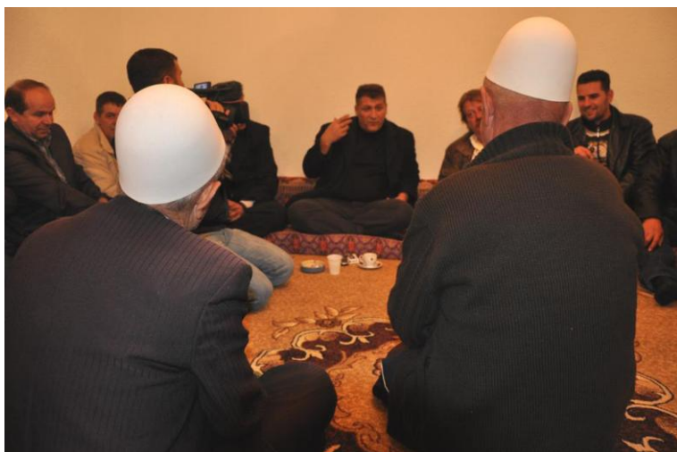
Zafiri në takime me qytetarë