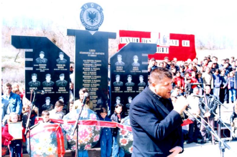
Zafiri në përvjetore të përkujtimit të dëshmorëve