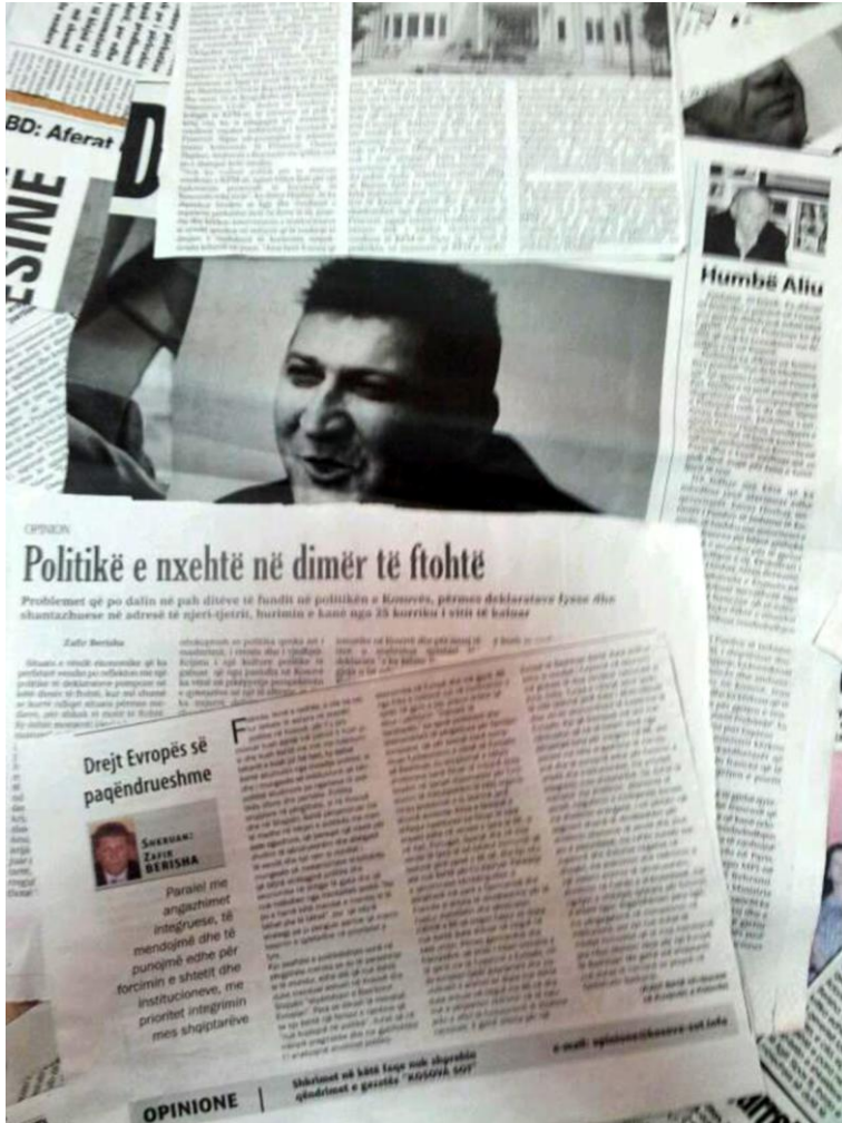
Zafiri prezent me shkrime publicistike dhe prononcime në shtypin e kohës