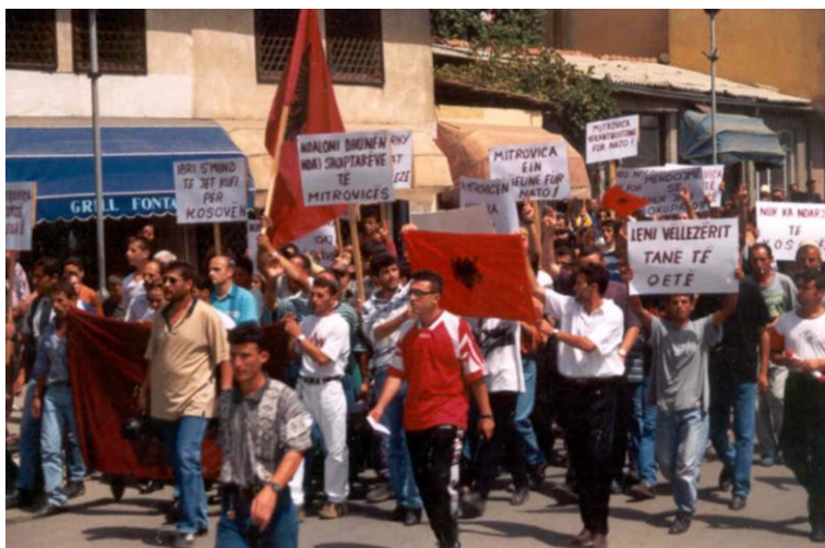
Zafiri qëndroi në ballë të shumë protestave për të burgosurit, të zhdukurit, për Mitrovicën dhe për TMK-në