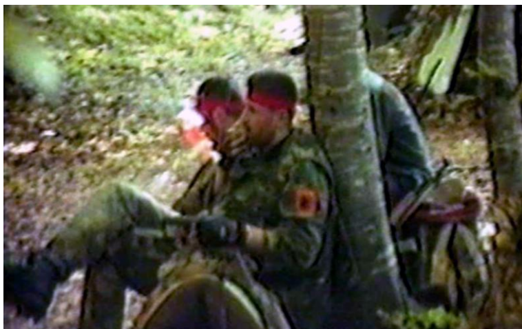
Zafiri në kompani ushtarak në malet e Jeshkovës