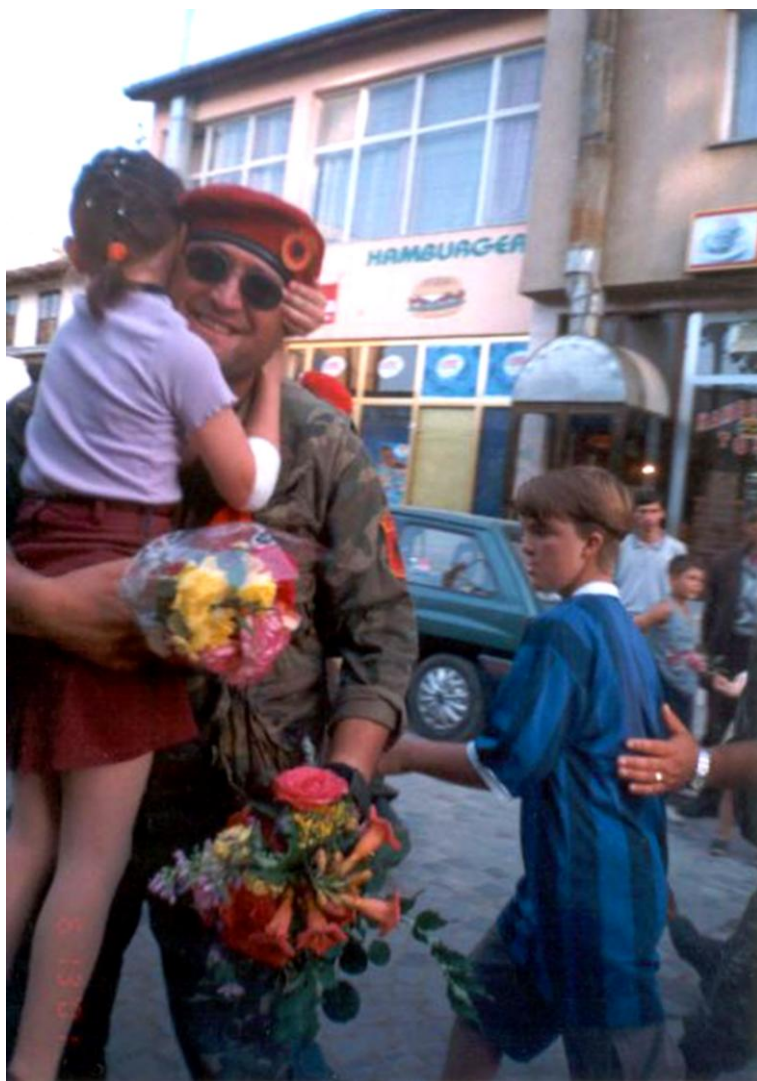
UÇK-ja pritet me lule nga qytetarët e Prizrenit, qershor 1999