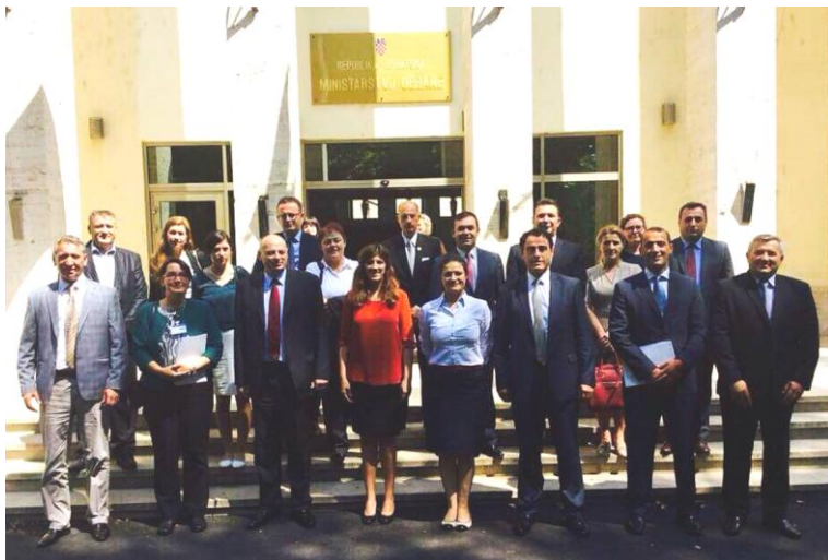
Zafiri me kolegët e tij deputetë të Kuvendit të Republikës së Kosovës gjatë një vizite zyrtare në Kroaci