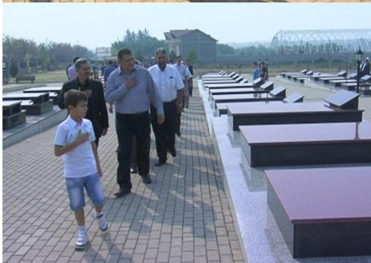
Zafiri me rastin e festave kombëtare, nderim dëshmorëve të UÇK-së në Landovicë