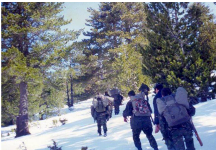
Duke thyer kufirin shqiptaro-shqiptar, mars 1999