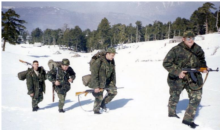
Duke thyer kufirin shqiptaro-shqiptar, mars 1999